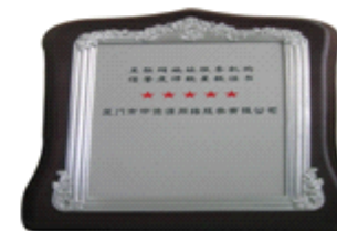
五星互联网地址服务机构