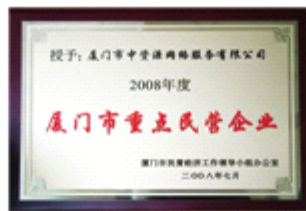
厦门市重点民营企业